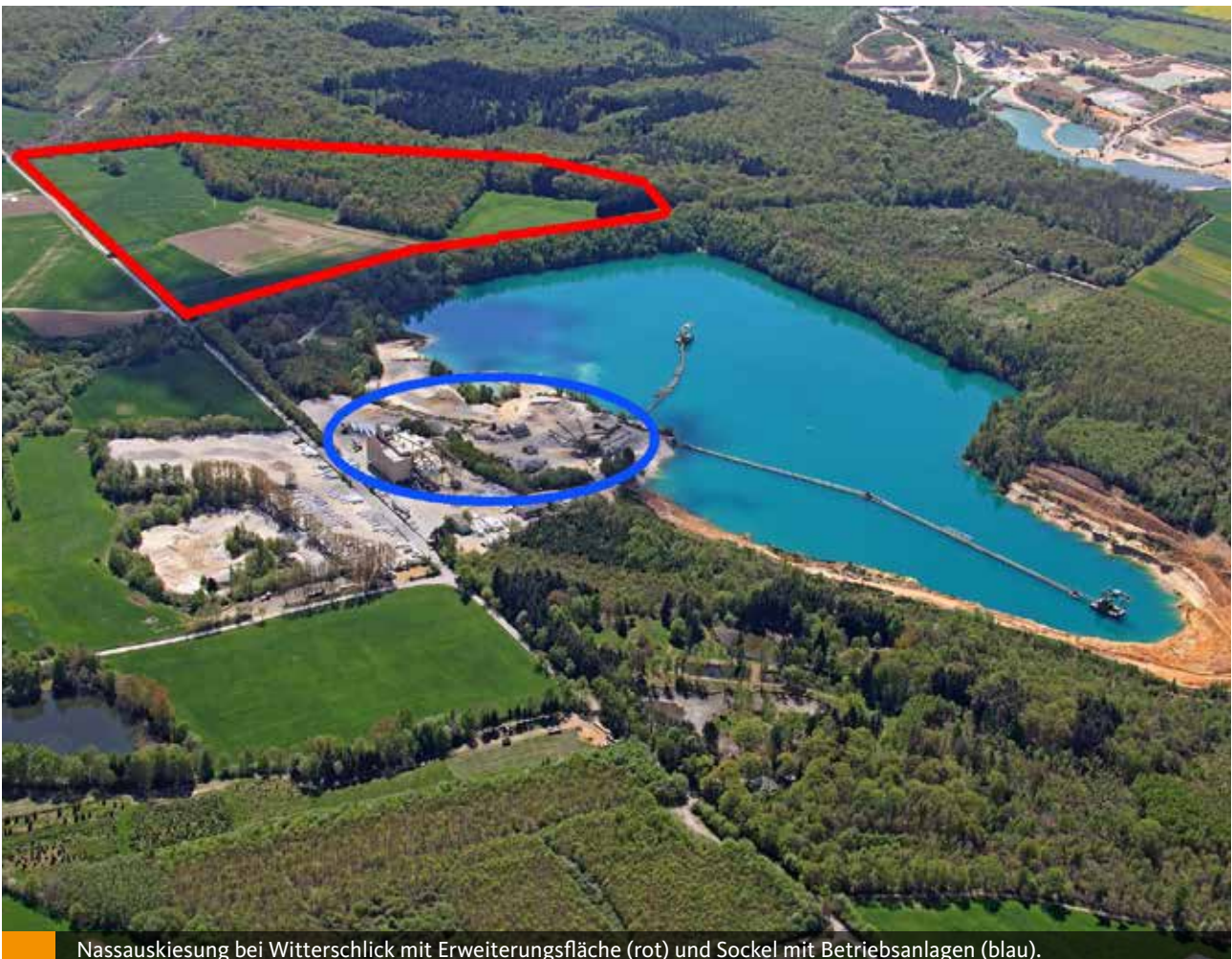
Nassauskiesung bei Witterschlick mit Erweiterungsfläche (rot) und Sockel mit Betriebsanlagen (blau).

Interessen abdeckt“, äußerte sich Donie. Um etwaigen Prognoseunsicherheiten bezüglich der langfristigen Rohstoffversorgung zu begegnen, wurde ebenfalls ein Monitoring beschlossen, welches die fortlaufende Richtigkeit der prognostizierten Abgrabungsmenge regelmäßig zu kontrollieren und ggf. anzupassen hat. Die Regionalplanungsbehörde wurde beauftragt, alle drei Jahre die Darstellung der Abgrabungsstätte und den Rohstoffbedarf zu überprüfen. Zudem soll auch die Überwachung der Auswirkungen auf das Grundwasser im Bereich der Wasserwerke Heimerzheim und Heidgen im Monitoringprozess mit aufgenommen werden.