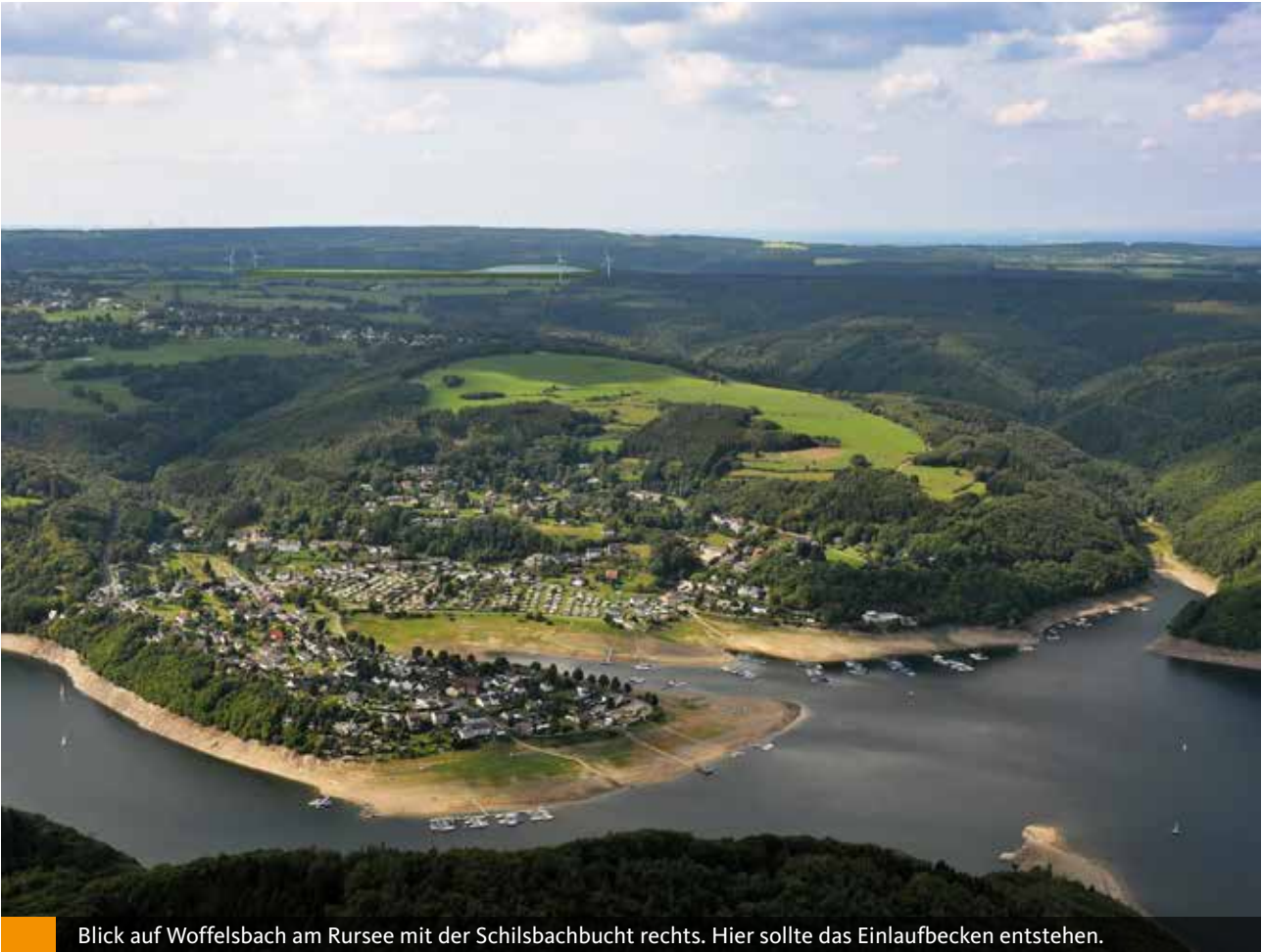
Blick auf Woffelsbach am Rursee mit der Schilfbachbucht rechts. Hier sollte das Einlaufbecken entstehen.