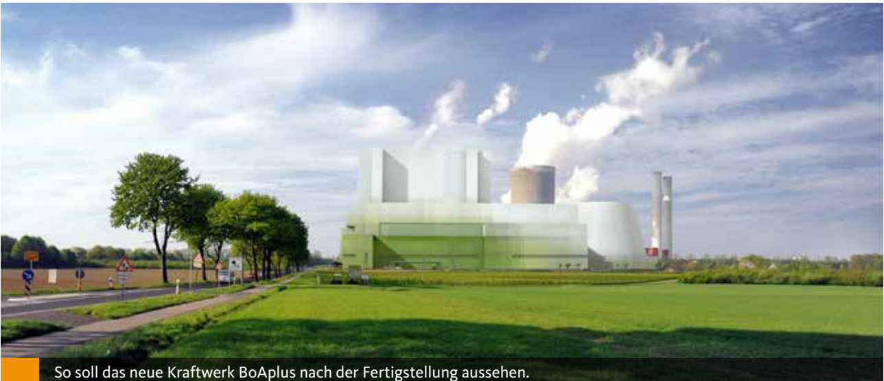
So soll das neue Kraftwerk BoAplus nach der Fertigstellung aussehen.