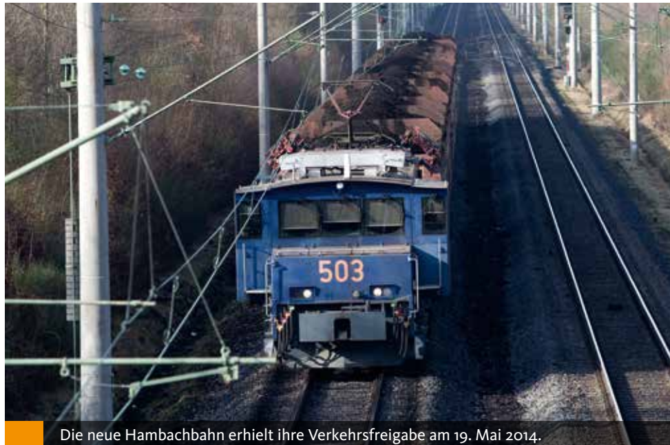
Die neue Hambachbahn erhielt ihre Verkehrsfreigabe am 19. Mai 2014.

Nach intensiver Beteiligung aus der Region und Berücksichtigung zahlreicher Anregungen aus dem Regionalrat in den letzten Jahren konnte am 18.10.2013 die 5. Änderung des Regionalplans Köln bekanntgemacht werden, so dass das Regionalplanänderungsverfahren für das Vorhaben