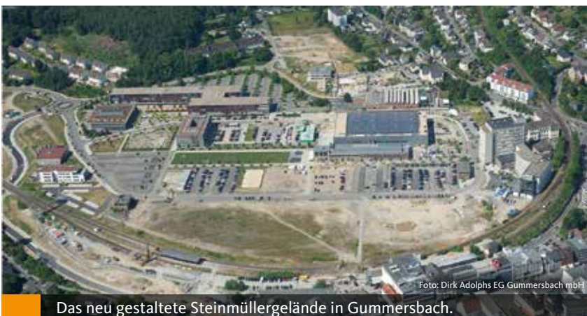
Das neu gestaltete Steinmüllergelände in Gummersbach.

Die Region Köln/Bonn hat also den „Rückenwind“ der -Regionale 2010 genutzt und wird auch weiterhin im Dialog ihre Zukunft gemeinsam gestalten.