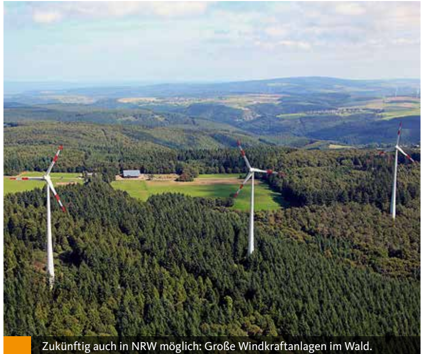
Zukünftig auch in NRW möglich: Große Windkraftanlagen im Wald.

Aus Sicht des Rheinlandes ist uns ganz besonders wichtig, das Rheinland als eine starke Wirtschaftsregion weiter zu entwickeln. Davon profitiert ganz Nordrhein-Westfalen. Dafür brauchen wir aber die nötigen Freiheiten, die ein detaillierter, für ganz Nordrhein-Westfalen einheitliche Maßstäbe vorgebender Plan wegen der Vielfalt des Landes gar nicht geben kann. Entgegen dem landesweiten Trend werden die Zentren entlang der Rheinschiene mit den angrenzenden Kommunen und der grenzüberschreitende Raum zu den Niederlanden und zu Belgien auch in Zukunft wachsen. Um die Position des Rheinlands als Wirtschaftsstandort zu festigen und auszubauen, muss auch ein bedarfsgerechtes Flächenangebot für Industrie, Gewerbe, Infrastruktur und Wohnen zur Verfügung gestellt werden. Gemeinsam mit meinem Kollegen, Hans-Jürgen Petrauschke, dem Vorsitzenden des Regionalrates Düsseldorf, habe ich monatelang dafür geworben, dass die beiden rheinischen Regionalräte eine gemeinsame Stellungnahme abgeben.