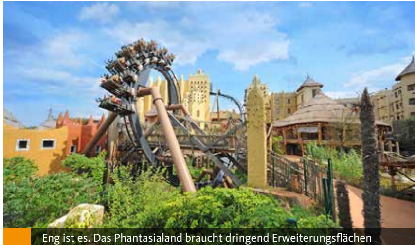
Eng ist es. Das Phantasialand braucht dringend Erweiterungsflächen