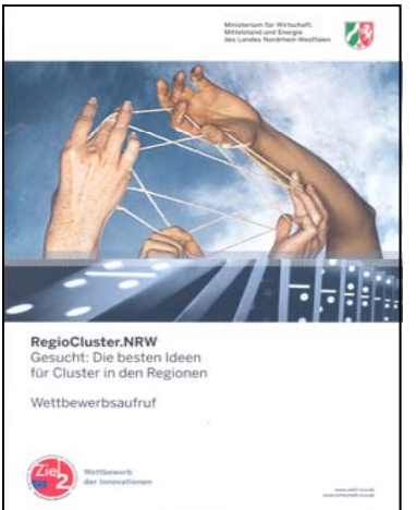
Die Broschüre ist erhältlich beim NRW Wirtschaftsministerium

Der Wettbewerb richtet sich an Unternehmen und andere Akteure der regionalen Wirtschaft in NRW. Auch Kommunen und Kommunalverbände können teilnehmen.